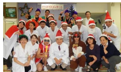
病院長と緩和ケアチームメンバーとエイサー隊