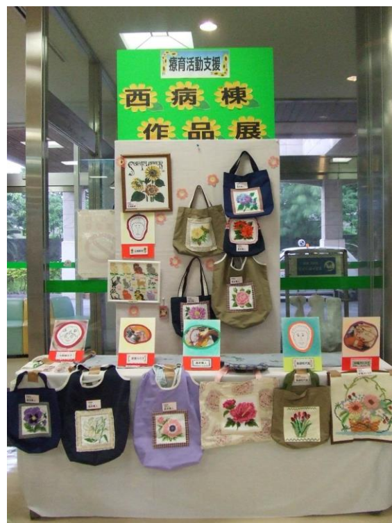
前年の様子(平成28年3月23日撮影)